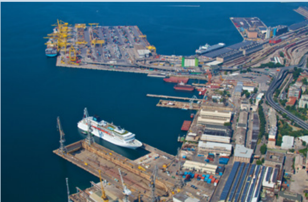
Una panoramica del porto di Trieste

avviato nei mesi scorsi. "Il Piano individua un assetto di lungo periodo per l'intera area portuale, con uno scenario di sviluppo che abbraccia i prossimi 20-25 anni" ha commentato la presidente della Regione, Debora Serracchiani, aggiungendo che "...il Piano valorizza al massimo le potenzialità naturali e storiche dello scalo, sia per la sua posizione geografica strategica che per la disponibilità di aree adeguate per la movimentazione e lo stoccaggio delle merci". ■