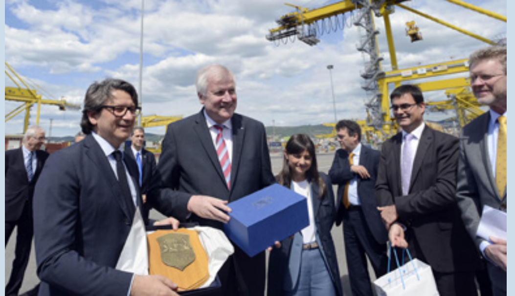
Il commissario dell'Authority di Trieste con il presidente della Baviera

territoriali, Camere di Commercio e Ferrovie. La Baviera, infatti, fa riferimento ai porti del Mediterraneo – e a quello di Trieste in particolare – sulla via più vantaggiosa per gli scambi commerciali con l'Asia. Nell'ambito del Piano d'azione della Regione Alpina (EUSALP), promosso dall'Unione Europea per incrementare competitività e solidarietà sociale, sono previste iniziative per sviluppare ricerca e innovazione, migliorare l'adeguamento del mercato del lavoro, l'istruzione e la formazione nei settori strategici, promuovere l'intermodalità nel trasporto merci e passeggeri. Sul percorso di attuazione dell'accordo, verrà effettuato un monitoraggio da parte dall'Ufficio di presidenza della Regione FVG e della Cancelleria di Stato bavarese, con una verifica generale nell'estate del 2018.