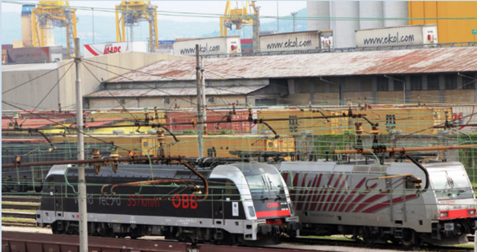
Locomotori in attesa nei pressi della stazione di Campo MARzio a Trieste. Sullo sfondo le gru del Molo VII

Gli interventi riguarderanno gli scambi e i tracciati della stazione di Campo Marzio