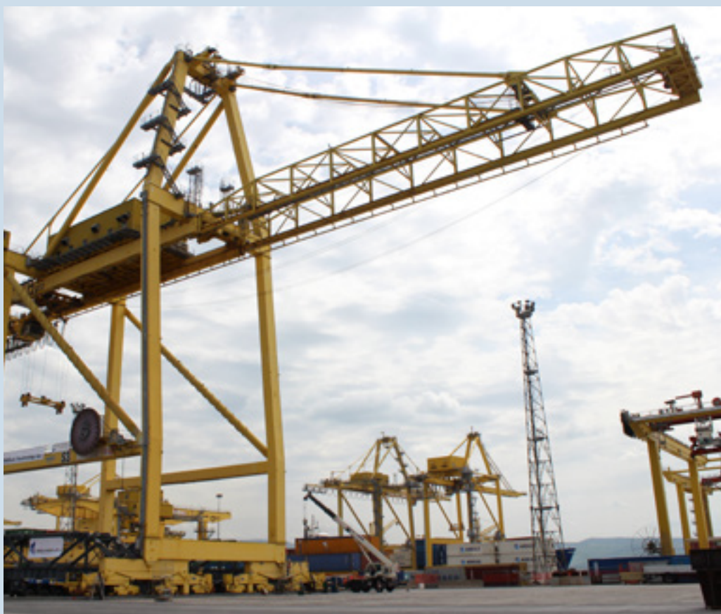
Molo VII, una delle gru in fase di upgrading

ed elettronica. In particolare, la gestione elettronica fornita dalla Siemens verrà rinnovata con l'installazione del sistema di "smart landing", per un migliore controllo delle operazioni di imbarco e sbarco dei contenitori. I lavori sulle tre gru, che si concluderanno entro un anno, saranno svolti da Cimolai Technology di Padova in Associazione temporanea d'impresa (ATI) con la Port Cranes srl di Reggio Emilia. ■