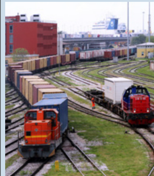
Treni in partenza dal porto di Trieste