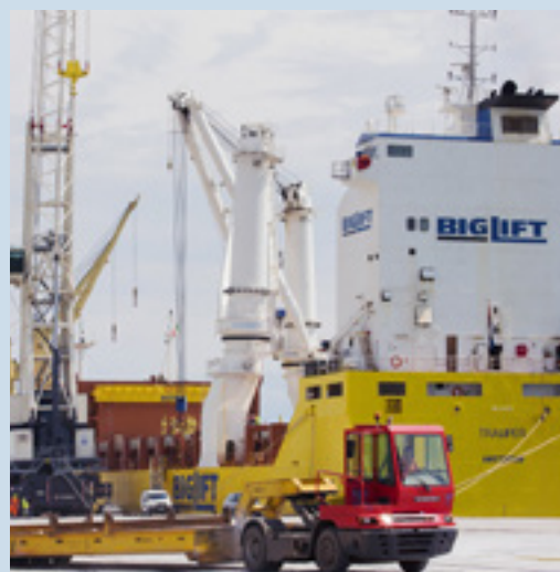
Una nave della Spliethoff al porto di Monfalcone

I carichi speciali sono stati imbarcati su una nave dell'olandese Spliethoff's e gestiti in banchina da CPM (Compagnia portuale di Monfalcone, parte del Gruppo TO Delta), accanto a materiale siderurgico e macchinari industriali.