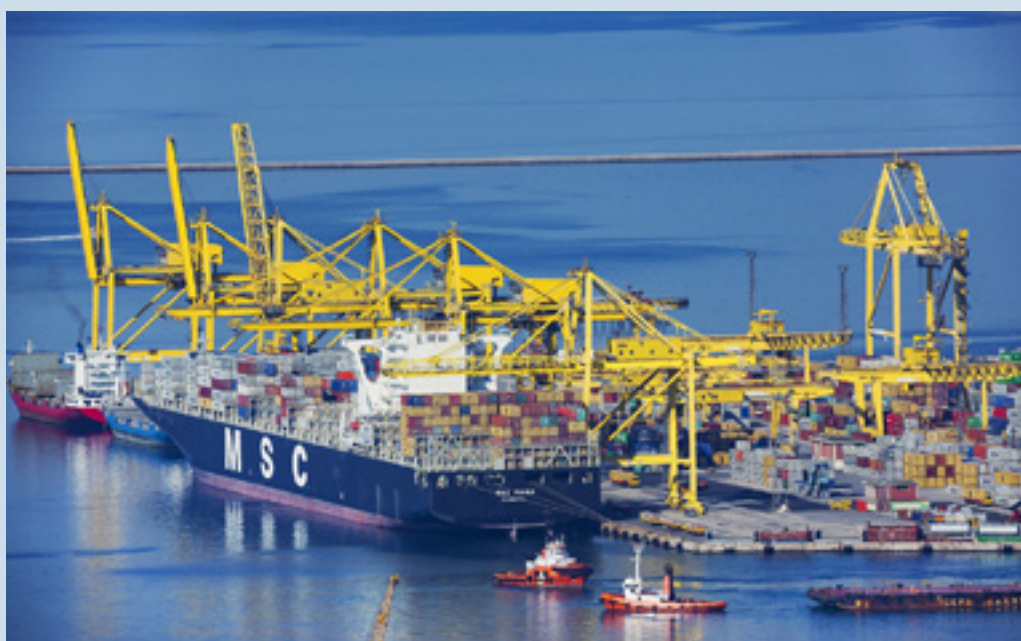
Il Molo VII del porto di Trieste, terminal contenitori dello scalo

TRIESTE - L'incerta situazione del mercato e l'evoluzione dello scenario nelle alleanze tra Compagnie di navigazione non hanno avuto ripercussioni sui volumi movimentati da Trieste Marine Terminal nel primo semestre 2016.